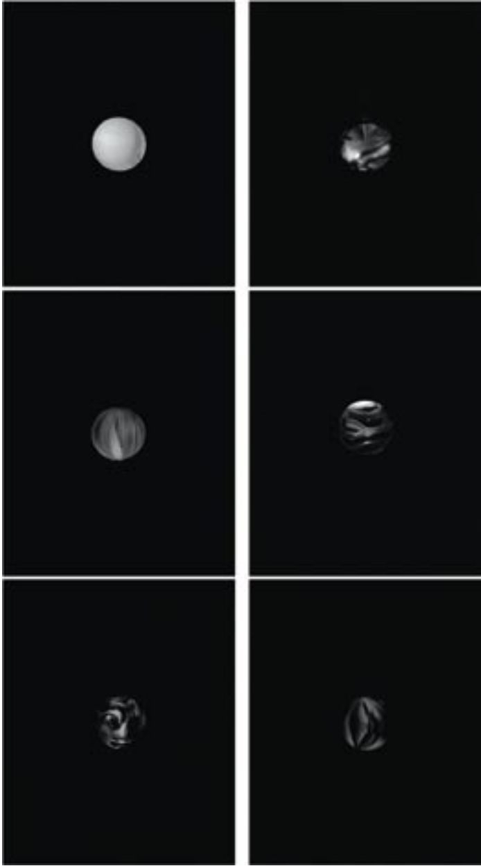
Hervé Durand, Les billes , 2000.