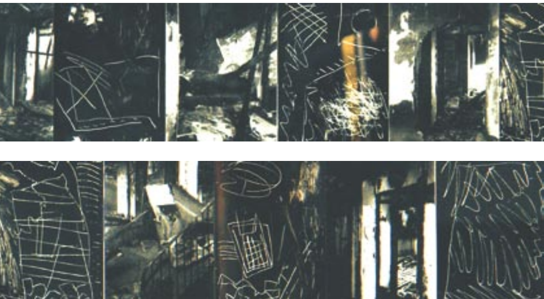
Jean Lemerre, Explosante/fixe , 1998 (détail)